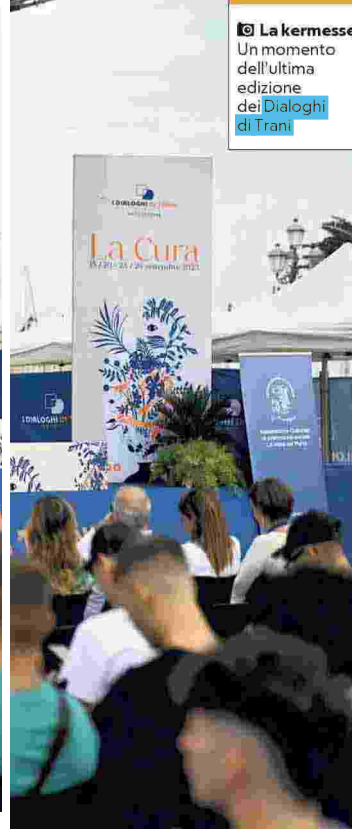
La kermesse Un momento dell'ultima edizione dei Dialoghi di Trani