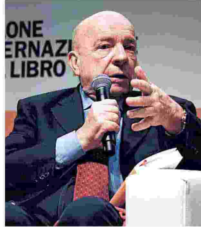
Il giurista Gustavo Zagrebelsky